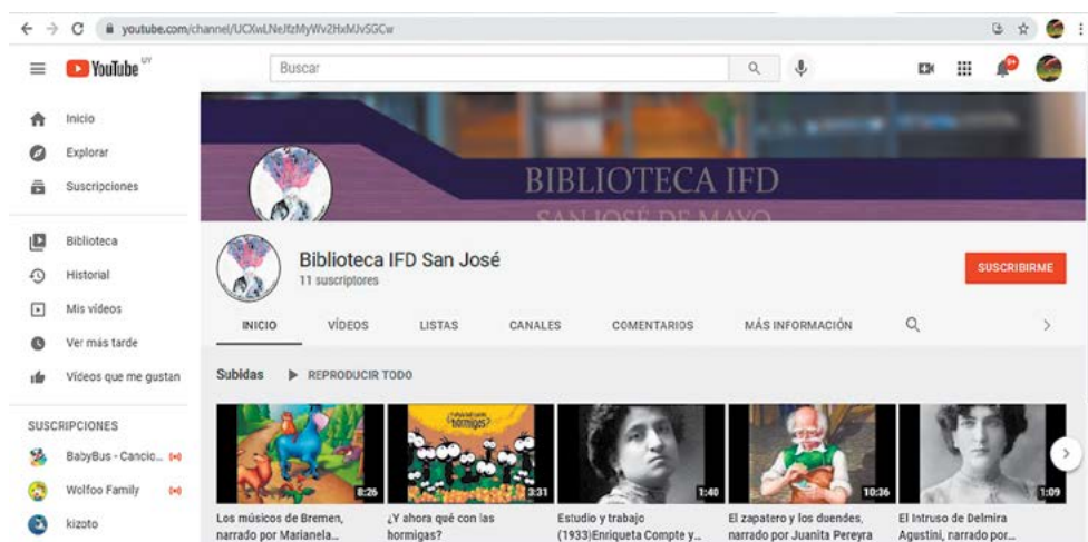
Imagen 1: Pódcast sobre cuentos clásicos infantiles y poesía narrativa (YouTube)

Pódcast enviados por la comunidad publicados en el canal de YouTube de la Biblioteca: https://www.youtube.com/channel/UCXwLNeJfzMyWv2HxMJvSGCw .