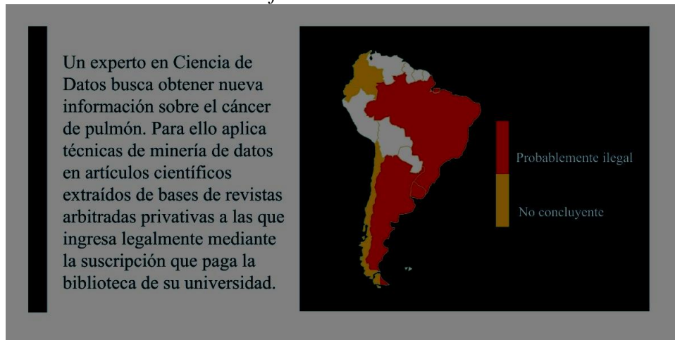
Gráfico 10: Escenario 8