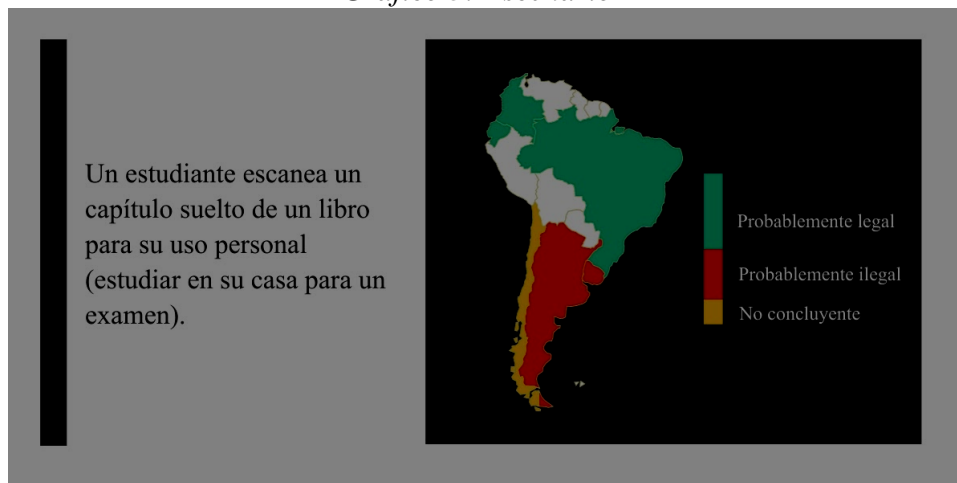
Gráfico 3: Escenario 1