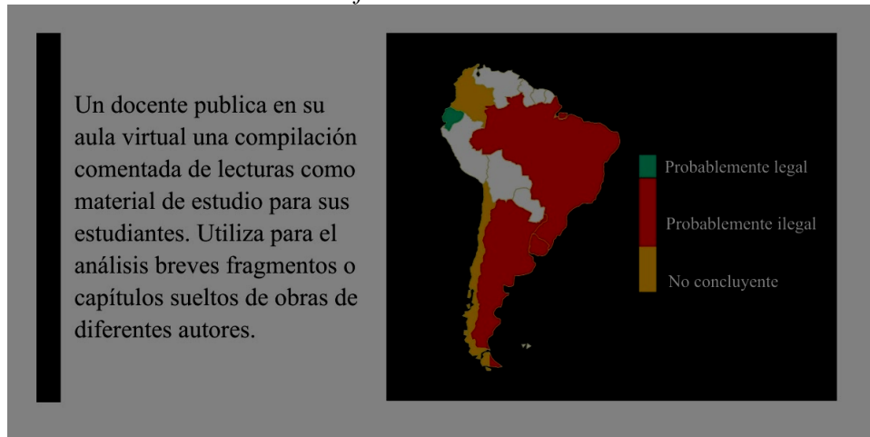
Gráfico 4: Escenario 2