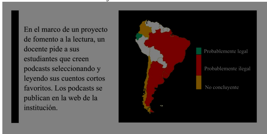
Gráfico 5: Escenario 3