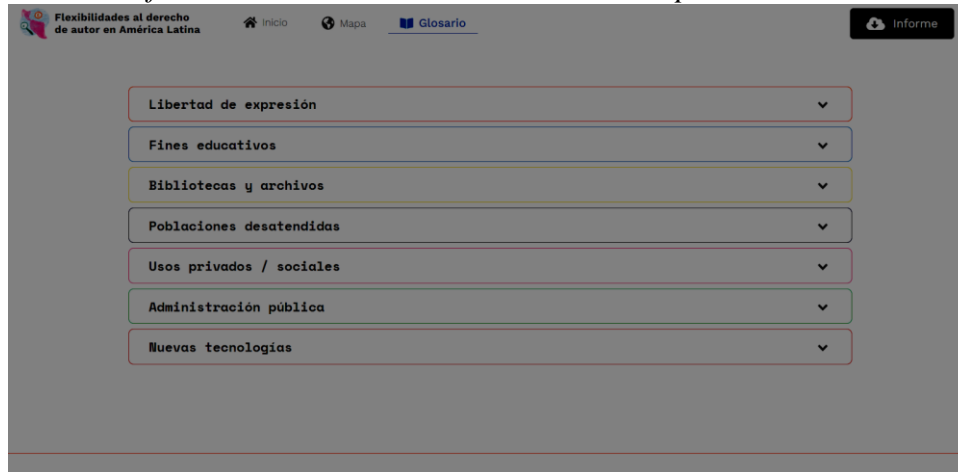
Gráfico 2: Glosario de la herramienta de mapas interactivos